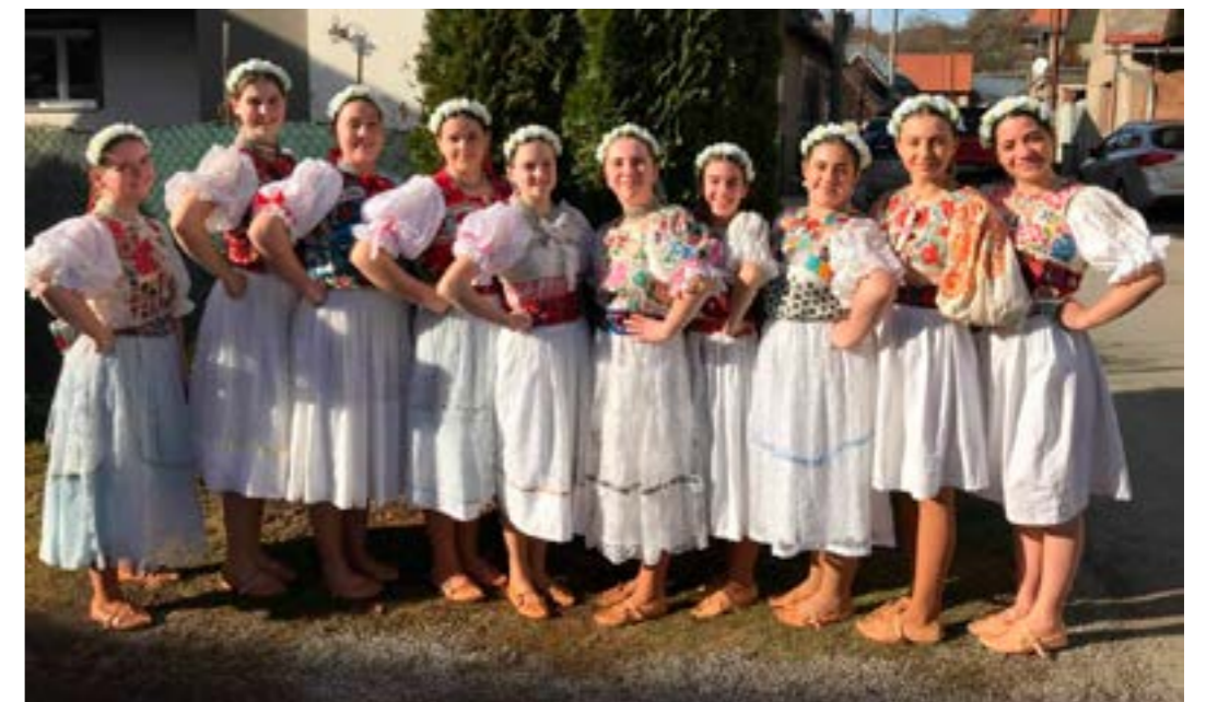
DFS Hučava II.

Sme nesmierne hrdí na naše deti a hlavne na to, že vďaka nim žije bohaté kultúrne dedičstvo našich predkov. Fotky sú zverejnené na stránke http://www.sosbb.sk/galerie2019/fujara/fujara.html (pokračovanie obr. príloha na str. 4)