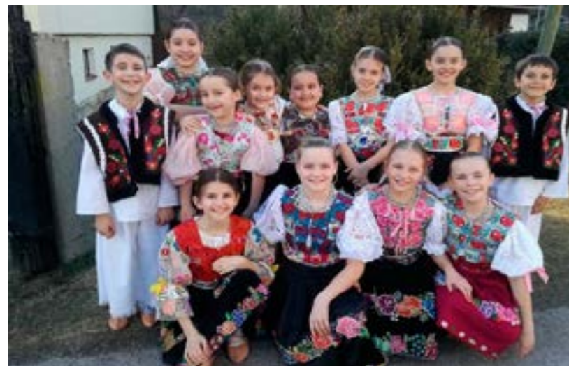
DFS Hučava I.